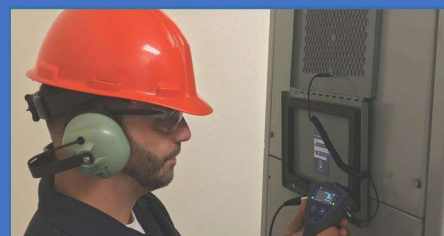
パネル設置型部分放電センサー PDS (オプション) を使用しての検査

中・高電圧金属閉鎖型開閉器の絶縁材料内部の部分放電の発生は瞬時接地電圧(TEV)と呼ばれる小電圧インパルスを誘発します。TEVはSONUS PDの静電容量式センサーにより検出することができます。これらの絶縁部品内部の部分放電を未検査で放置すると電気設備の壊滅的な故障を引き起こします。